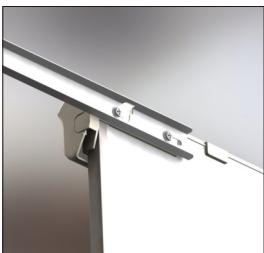
Faltbare Stangen für zusätzliches Papier