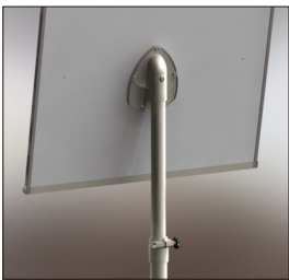
Höhenverstellbar von Flipchart (Rückseite)